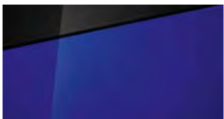
Intense Blue Pearl + € 795 Optioneel met dak in Phantom Black + € 895