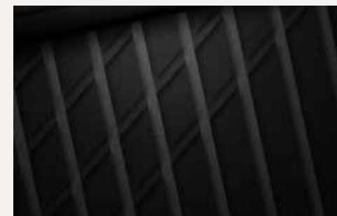
Stof, grijs & zwart (Comfort & Premium)