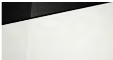
Polar White Solid Optioneel met dak in Phantom Black + € 195