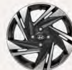
16-inch lichtmetalen velg