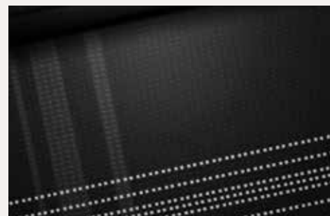
Stof, grijs & zwart (i-Motion)