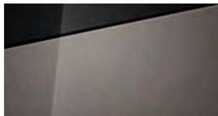
Brass Pearl + € 795 Optioneel met dak in Phantom Black € 895