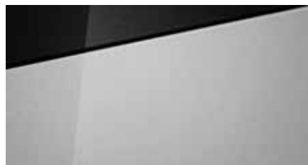
Sleek Silver Metallic + € 695 Optioneel met dak in Phantom Black + € 795