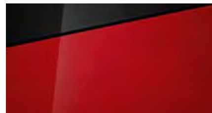
Dragon Red Pearl + € 795 Optioneel met dak in Phantom Black € 895